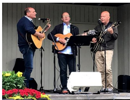
Zon Fem framför egna visor med inslag av country.