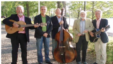
"Prästen & Resten"

14.45 Visor och dikter, till eftertanke och nöje.